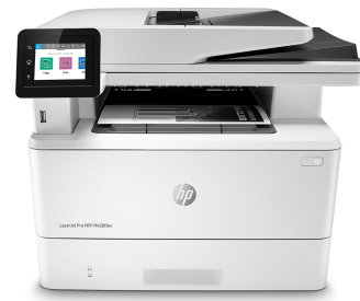
Stampante multifunzione HP LaserJet Pro M428fdw

Stampante con funzionalità di sicurezza dinamica. Da utilizzare solamente con cartucce dotate di chip HP originale. Le cartucce con un chip non HP potrebbero non funzionare e quelle che attualmente funzionano potrebbero non funzionare in futuro. Per saperne di più visitare: