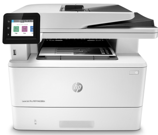
Stampante multifunzione HP LaserJet Pro M428fdn

Un business di successo è frutto di un modo di lavorare intelligente. La multifunzione HP LaserJet Pro M428 è progettata per consentirvi di concentrarvi su ciò che fa crescere efficacemente il vostro business e restare sempre un passo avanti rispetto alla concorrenza.