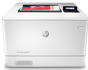
Stampante HP Color LaserJet Pro M454dn

Un business di successo è frutto di un modo di lavorare intelligente. La stampante HP Color LaserJet Pro M454 è progettata per consentirvi di concentrarvi su ciò che fa crescere efficacemente il vostro business e restare sempre un passo avanti rispetto alla concorrenza.