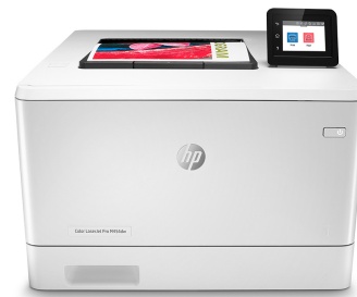
Stampante HP Color LaserJet Pro M454dw

Stampante con funzionalità di sicurezza dinamica. Da utilizzare solamente con cartucce dotate di chip HP originale. Le cartucce con un chip non HP potrebbero non funzionare e quelle che attualmente funzionano potrebbero non funzionare in futuro. Per saperne di più visitare: