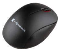
Mouse Bluetooth Dynabook silenzioso T120 (PA5349E-1ETE)