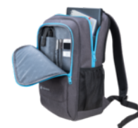
Zaino Dynabook per notebook da 15,6" (PX2002E-1NCA)