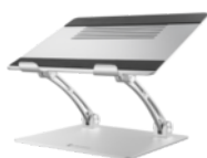
Supporto regolabile Dynabook per notebook (PS0106EA1STA)